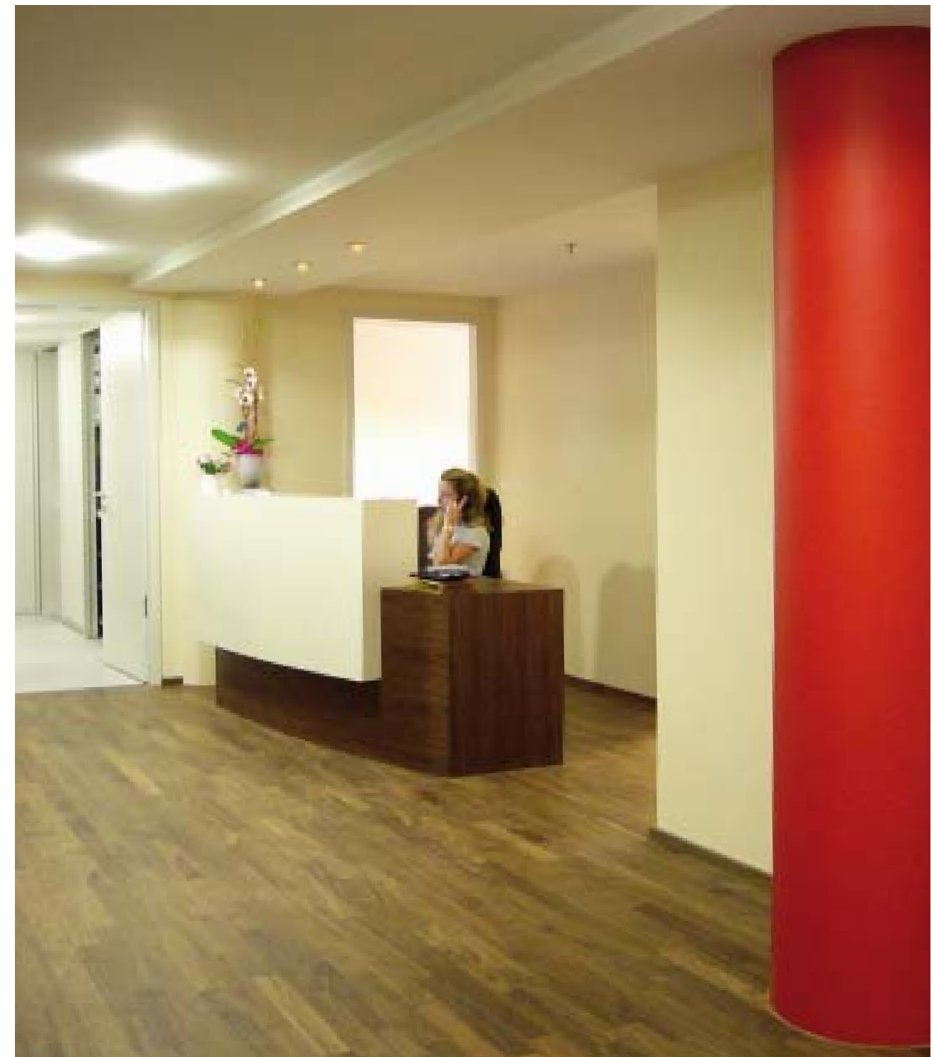
Boesel Benkert Hohberg Architekten