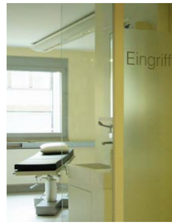
Zentrum für plastische Chirurgie, München