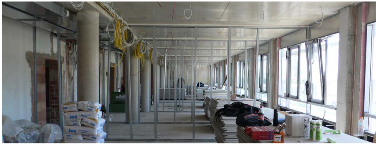
Klinikum Traunstein Sanierung Westflügel für Pflege- und Intensivpflege

Für die Sanierung des sog. Westflügels wurden wesentliche Eingriffe in die bestehende Bausubstanz, sowie der Teilabbruch der südlichen Gebäudespanne erforderlich. Um den Krankenhausbetrieb so lange und gut wie möglich aufrecht zu erhalten, wurde die Sanierung und der eingestellte Neubau in fünf aufeinander abgestimmte Abschnitte aufgeteilt. Das zukünftige Gebäude bietet folgende Funktionsbereiche: Tages- mit Schmerztagesklinik, Onkologie, Aufnahme- und Stroke-Unit, Intermediate-Care Station, Brustzentrum und drei Pflegestationen, davon eine als Privatstation. Insgesamt werden 110 Betten realisiert. Zur "Genesung im Grünen" mit Blick auf das Alpenpanorama erhalten die Patientenzimmer großflächige Verglasungen. Der gewünschte Lichteinfall kann mittels elektromotorischer Fallarmmarkisen an jede Tages- und Jahreszeit angepasst und optimiert werden.