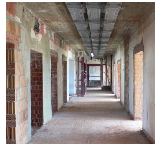
Klinikum Traunstein Sanierung Westflügel für Pflege- und Intensivpflege

Für die Sanierung des sog. Westflügels wurden wesentliche Eingriffe in die bestehende Bausubstanz, sowie der Teilabbruch der südlichen Gebäudespanne erforderlich. Um den Krankenhausbetrieb so lange und gut wie möglich aufrecht zu erhalten, wurde die Sanierung und der eingestellte Neubau in fünf aufeinander abgestimmte Abschnitte aufgeteilt. Das zukünftige Gebäude bietet folgende Funktionsbereiche: Tages- mit Schmerztagesklinik, Onkologie, Aufnahme- und Stroke-Unit, Intermediate-Care Station, Brustzentrum und drei Pflegestationen, davon eine als Privatstation. Insgesamt werden 110 Betten realisiert. Zur "Genesung im Grünen" mit Blick auf das Alpenpanorama erhalten die Patientenzimmer großflächige Verglasungen. Der gewünschte Lichteinfall kann mittels elektromotorischer Fallarmmarkisen an jede Tages- und Jahreszeit angepasst und optimiert werden.