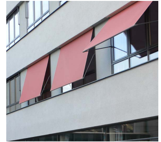
Klinikum Traunstein Neubau Südflügel für Pflege, Verwaltung und Druckkammerzentrum

Die Druckkammer aus Stahl mit einem Gewicht von 20 t wurde mittels Schwerlastkran in das Untergeschoss eingebracht.