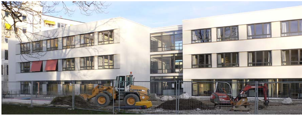
Klinikum Traunstein Neubau Südflügel für Pflege, Verwaltung und Druckkammerzentrum

Der Erweiterungsbau Südflügel umfasst zwei Pflegestationen mit je 31 Betten in den Obergeschossen, die Verwaltung im Erdgeschoss und ein Druckkammerzentrum sowie Personalumkleiden im Untergeschoss.