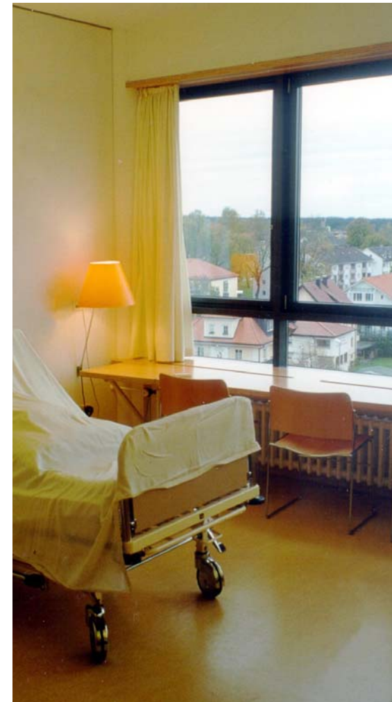
Andreas Boesel Dipl.Ing. Architekt

Festverglastes Brüstungselement ermöglicht Ausblick für Liegendkranke auf ganzer Zimmerbreite. Dimmbare Fassadenlampe und naturfarbener Vorhang schafft wohnliche Atmosphäre. Fassadenboard ersetzt herkömmlichen Esstisch und lädt zum Sitzen und Verweilen ein. Krankenzimmer wirkt bei festgeschriebener förderfähiger Zimmergröße großzügiger.