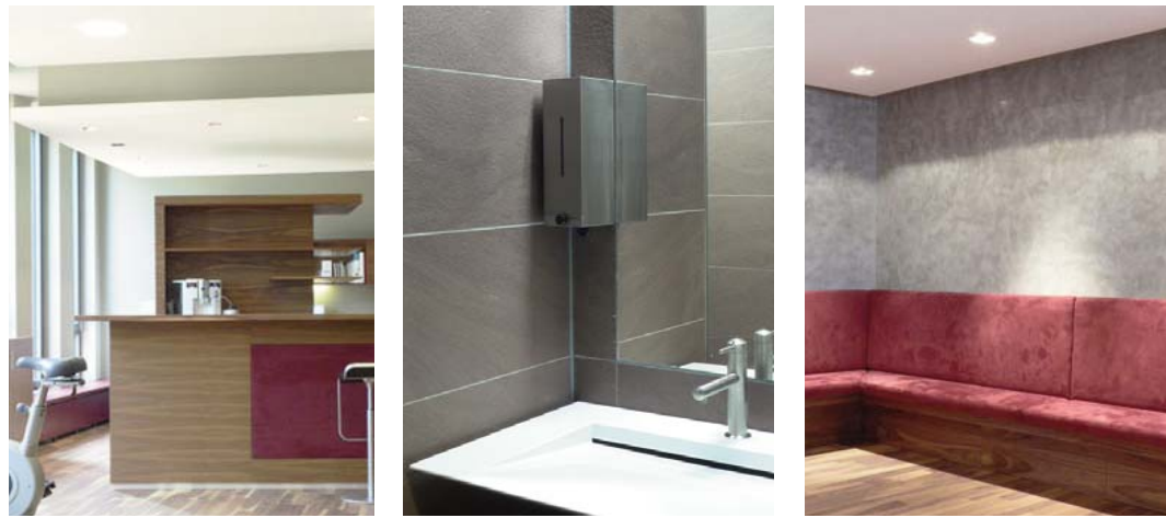
Pro Health Institut, Therapiepraxis Grasse & Mitsch, München

“Erlebe Deine Energie!”, das Motto des Pro Health Institut der Therapeuten Grasse & Mitsch. Die 800 qm Grundfläche, wurden in vier Funktionsbereiche gegliedert :