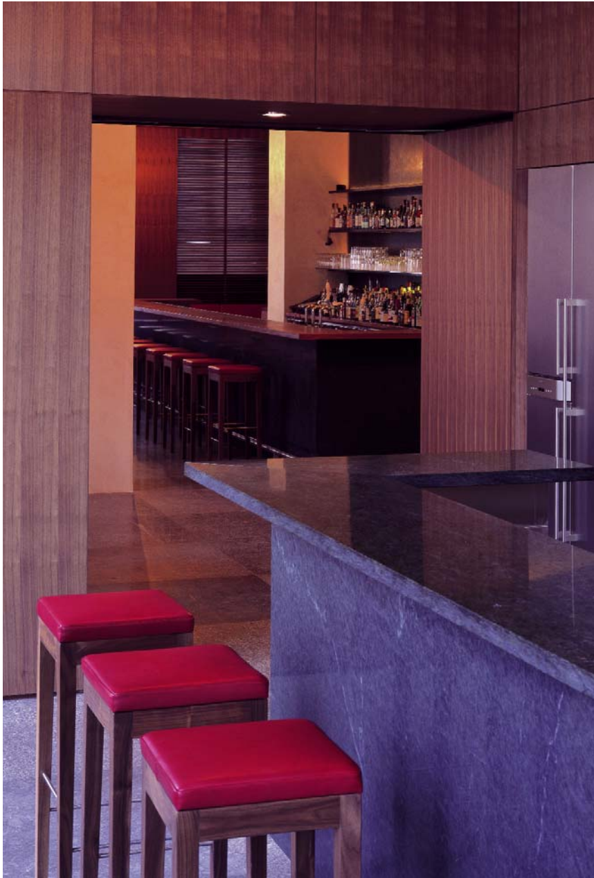
Boesel Benkert Hohberg Architekten

raumgestaltende Materialien: Bodenbelag: Kirchheimer Muschelkalk (Blaubank), Plattengröße: bis 1,02 x 1,30 m Tresen: Naturstein, Serpentin Holzwandvertäfelung: Amerikanisches Nussbaumfurnier Barhocker: Amerikanischer Nussbaum, Massivholz Lederbezüge: rotes Rindsnarbenleder, Skandinavien Decken und Wände: Spachteltechnik, Kalk-Grigio, Oberfläche dreifach geseift Flächenbündige Dreikammer-Klimaschränke mit Glas- und Edelstahlfronten