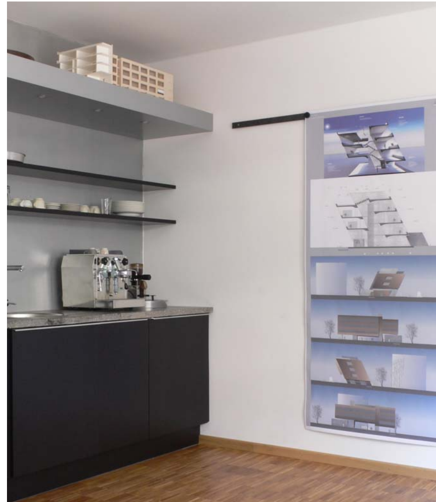
Boesel Benkert Hohberg Architekten