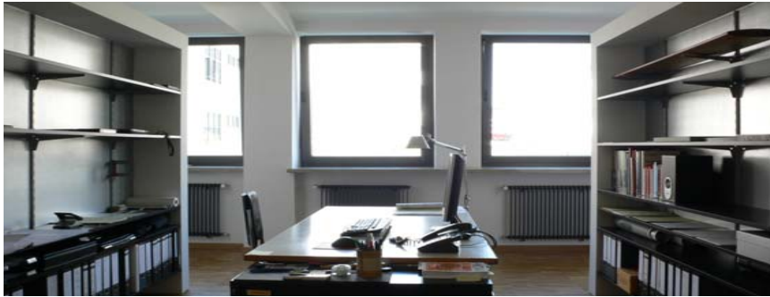
Boesel Benkert Hohberg Architekten, München

Ausbau eines bestehenden 230 qm Lofts nahe der Münchner Innenstadt zu eigenen Büroräumen der Boesel Benkert Hohberg Architekten.