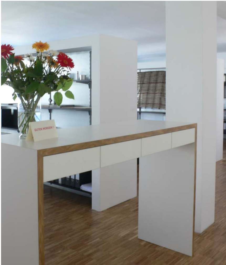
Boesel Benkert Hohberg Architekten