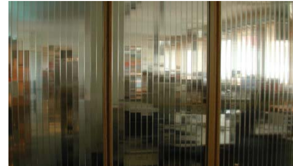
MediaCom Service München Loftumbau für eine Medienagentur

Die transluzente Trennwand zwischen dem Creative - und dem Aufenthaltsbereich wahrt Intimität und erhält die Einsicht in den Arbeitsraum.