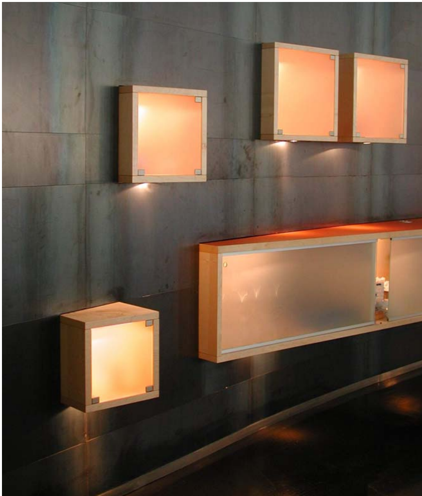
MediaCom Service München Loftumbau für eine Medienagentur