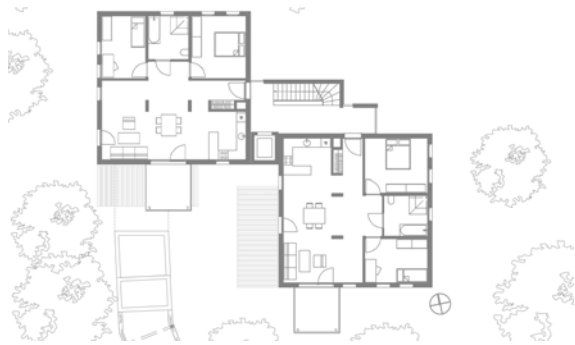
Mehrfamilienhaus in München Obermenzing